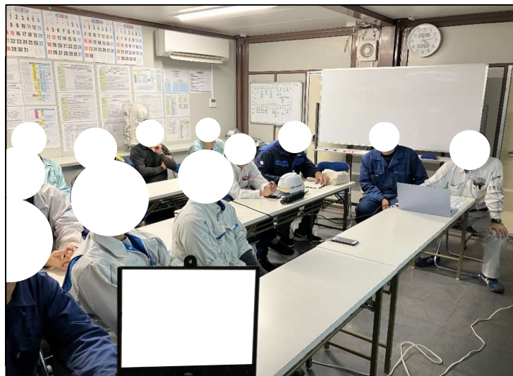
事故再発防止研修の実施状況