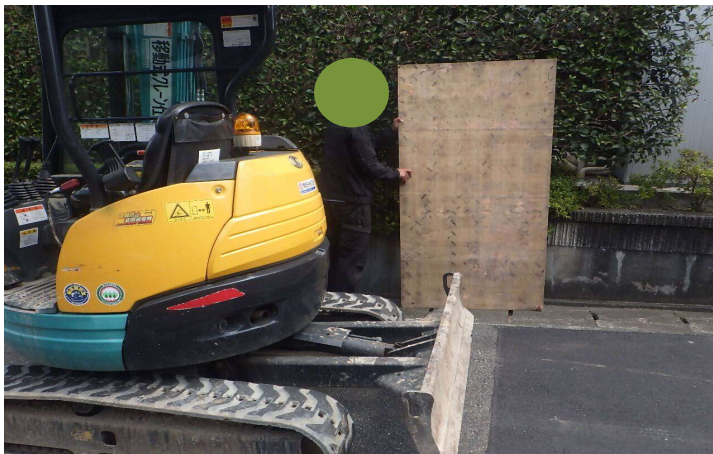
民地植栽側へコンパネの配置状況